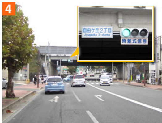
4 宗像郵便局を過ぎると上に国道3号線のある交差点(自由ヶ丘2丁目)があります。そのまま直進します。