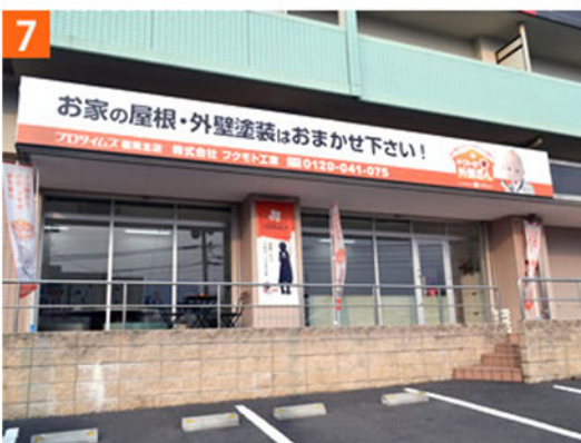
7 プロタイムズ福岡北店 株式会社フクモト工業に到着です!