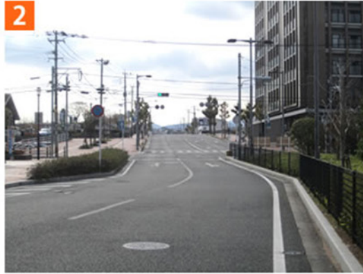
2 JR赤間駅南口を背にして南に向かいます。(最初の信号です)