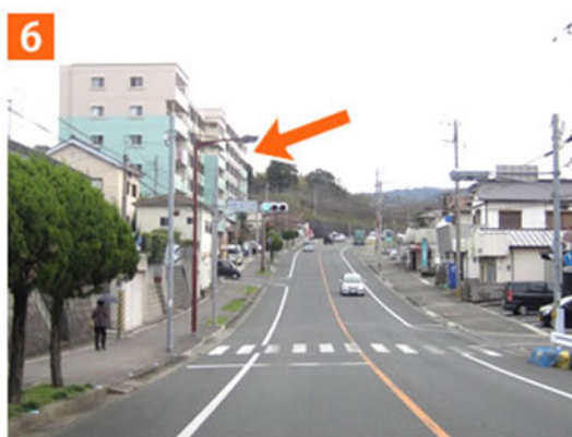
6 左手にスーパーサニーに見て南へ直進してくると(自由ヶ丘1丁目交差点)左手に建物の下半分がグリーンのマンションがあります。そのマンションの1階になります。