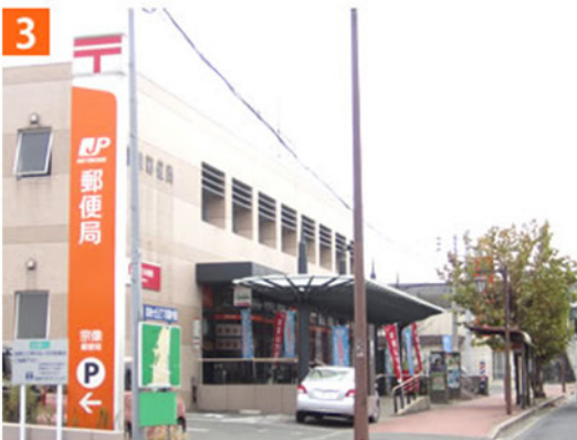
3 左手に宗像郵便局があります。そのまま直進します。