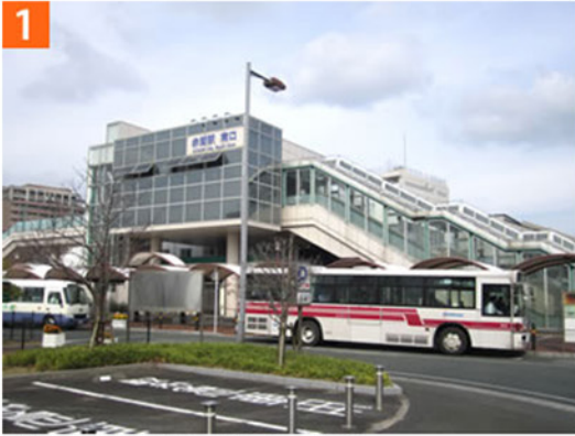
1 JR赤間駅南口からスタートします。